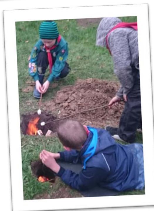
Juniorer - bålmærke