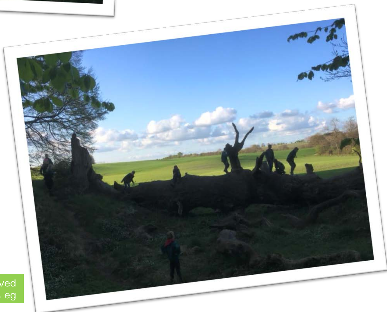
Juniortropen ved Niels Ebbesens eg