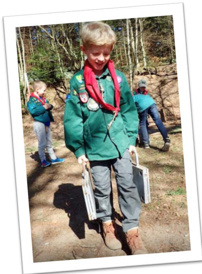
Billeder fra Sct. Georgsløb